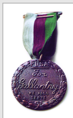
Le dispensaire des animaux malades Médaille Dickin de la PDSA

Au début de 1944 durant la bataille pour s'emparer du Monte Cassino dans les environs de Rome, une compagnie de Ghurkhas népalais et de soldats britanniques furent bloqués sur la colline Hangman, un rocher saillant près d'un monastère. Les bombardiers américains leur larguèrent de la nourriture et de l'eau, mais une