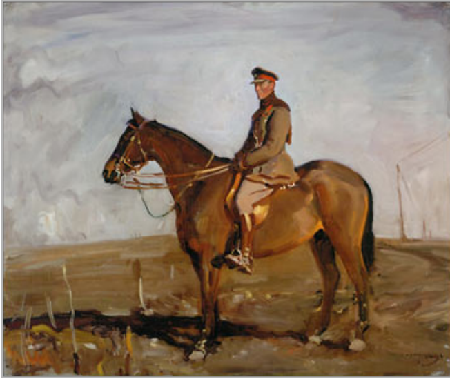
Le général Jack Seely et Warrior, par Sir Alfred Munnings, en 1918 au Musée des beaux-arts du Canada

courtois, bien que féroces. À la fin de la guerre, huit millions de chevaux avaient péri des deux côtés. Certains d'entre eux furent déchirés sous la mitraille; d'autres ont sauté sur des obus. La plupart sont toutefois morts des suites de l'exposition aux balles, de maladies ou de faim, pendant qu'ils transportaient des hommes, des munitions et des pièces d'équipement. La tactique des tranchées de la Grande Guerre a transformé l'art de la guerre.