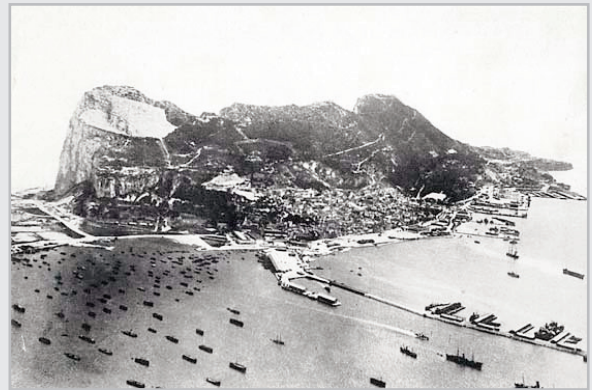
Le Rocher de Gibraltar