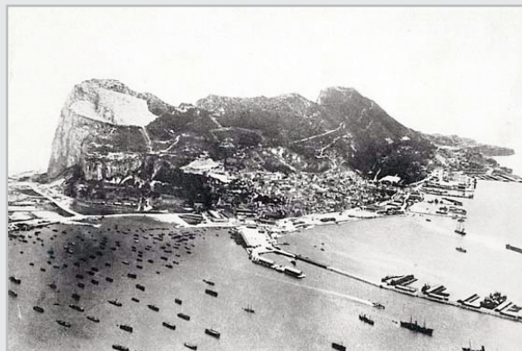
Le Rocher de Gibraltar